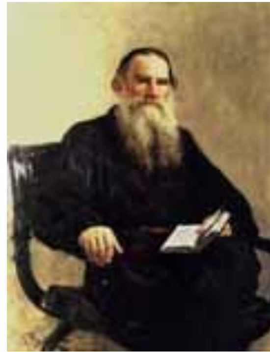
Портрет: Л. Н. Толстой. Художник И. Репин