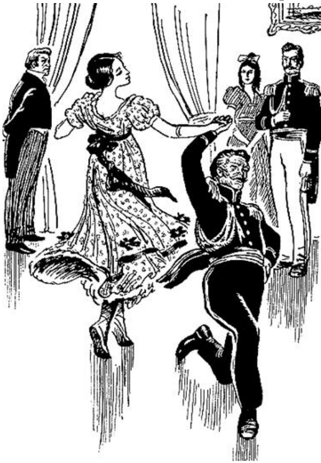
Бал у губернского предводителя

Рассказ строится как последовательное и контрастное изображение двух эпизодов: